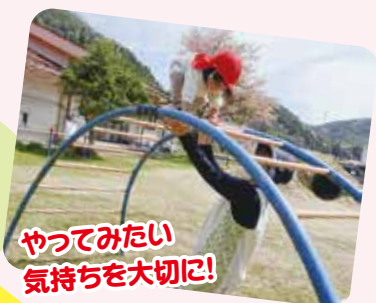
やってみたい 気持ちを大切に!