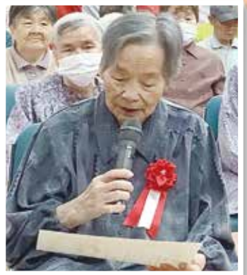
島根県内最高齢の利用者様よりお言葉を頂きました。

9月18日に敬老祝賀会、および敬老会が行われ、多くの方が敬老の表彰を受けられました。