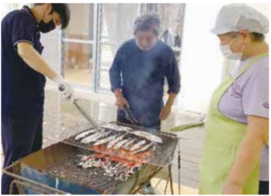
利用者様と共同で秋刀魚を炭火で焼いて昼食時に堪能して頂きました。