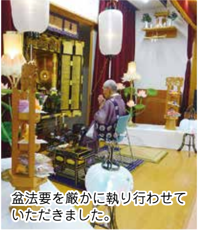
盆法要を厳かに執り行わせていただきました。